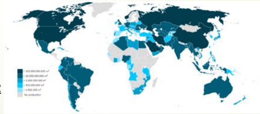
Pays classés par volume de gaz extrait (m3/an)